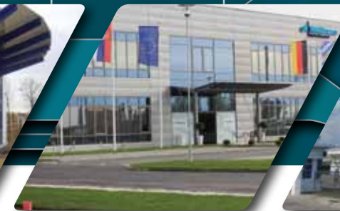
STARA PAZOVA, SERBIEN