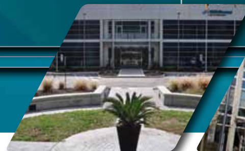
NEWPORT NEWS, USA